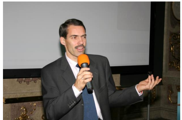
bei einem Vortrag 2005

Wögerbauer Athletic Solutions 2533 Klausen-Leopoldsdorf 37 Tel : 0664 / 8342806 e-mail : office@wir-bewegen-dich.at www.wir-bewegen-dich.at