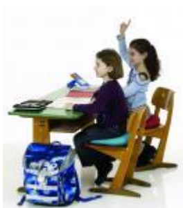
Dynair Premium Keil- Ballkissen Kids

Für die Schule und zu Hause .. Aufbau der Stütz Muskulatur durch dynamisches Sitzen