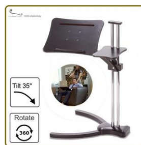
Lounge-wood ab € 560.-