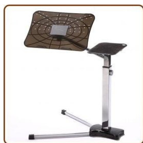
Lounge-book „ Chrome “ € 229.-