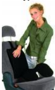
Airgo Aktiv Rücken- kissen Comfort & Rollstuhl Rückenkissen

Entspannt Sitzen durch anschmiegsames Luftkissen. Hilft der Wirbelsäule und den Bandscheiben auch im Sitzen aktiv zu bleiben. Gibt dem Rücken bei jeder Bewegung punktgenaue Unterstützung, fördert die aufrechte Sitzposition. Entspannend für Schulter- und Nackenbereich. Nimmt die Atemschwingungen auf und setzt diese in kleine, feine Bewegungen um. Mit Luftpumpe zur individuellen Einstellung