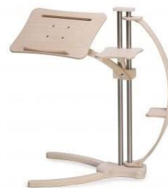
Lounge-wood „ Sail version “ ab € 660.-

Alle Preise sind inklusive Mehrwertsteuer und Versand. Details auf unserer Homepage.