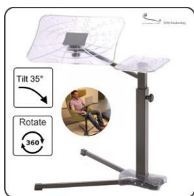
Lounge-book ab € 154.-