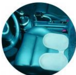
Airgo Aktiv Sitzkissen

Anschmiegsames Luftkissen, passt sich anatomisch an. Kleine feine Bewegungen halten die Wirbelsäule und Bandscheiben im Sitzen in Schwung. Nimmt Ihre Atemschwingungen auf und setzt diese in kleine, feine Bewegungen um. Aktivierend für die gesamte Rumpfmuskulatur.