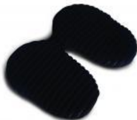
Airgo Aktiv Sitzkissen Comfort & Airgo Rollstuhl Sitzkissen

Kann den Beckenboden und die Prostata entlasten. Einfach mitnehmen: ob im Auto, Bus, Stadion etc. - immer und überall angenehm beweglich sitzen. Mit Luftpumpe zur individuellen Einstellung.